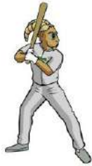
TABLA DE POSICIONES BEISBOL