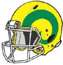
TABLA DE POSICIONES TOCHITO