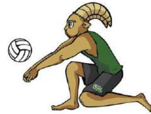
TABLA DE POSICIONES VOLEIBOL DE PLAYA