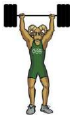
TABLA DE POSICIONES LEVANTAMIENTO DE PESAS