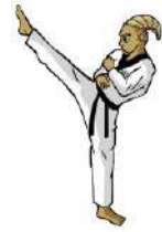
TABLA DE POSICIONES TAE KWON DO