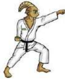
TABLA DE POSICIONES KARATE DO