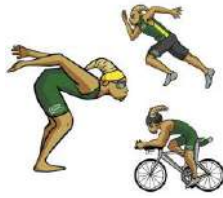
TABLA DE POSICIONES TRIATLON