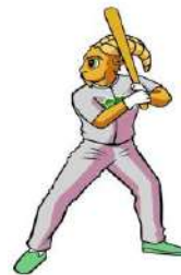
TABLA DE POSICIONES SOFTBOL