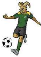
TABLA DE POSICIONES FUTBOL DE BARDAS