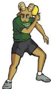
TABLA DE POSICIONES TENIS DE MESA