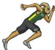
TABLA DE POSICIONES ATLETISMO