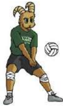
TABLA DE POSICIONES VOLEIBOL DE SALA