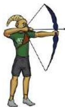
TABLA DE POSICIONES TIRO CON ARCO