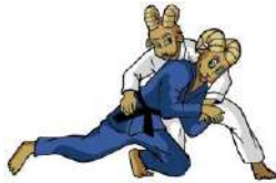
TABLA DE POSICIONES JUDO