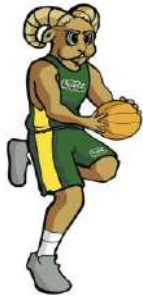
TABLA DE POSICIONES BALONCESTO