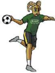
TABLA DE POSICIONES HANDBALL